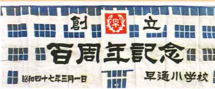
昭和47年 創立100周年 手ぬぐい