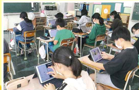
令和2年 全児童に学習用タブレット配布