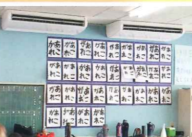
令和元年 普通教室にエアコン設置