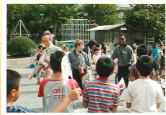
平成15年 南アフリカ大使館 ウルバノ代理大使 学校訪問