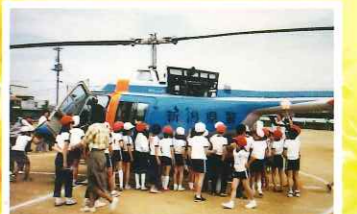
昭和62年 交通安全教室に新潟県警の ヘリコプターこしかぜ号が登場