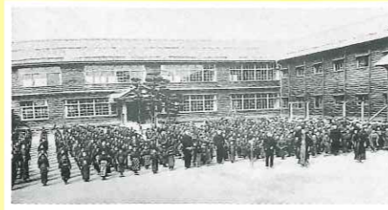
大正3年 全校生徒集合