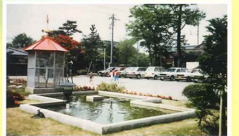
昭和62年 前庭に鳥小屋・池設置