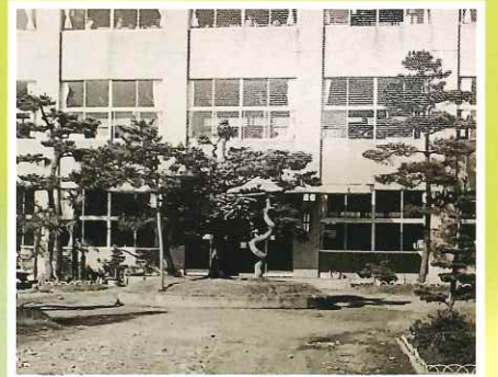
昭和47年 創立100周年記念 玄関前ロータリー・松植樹