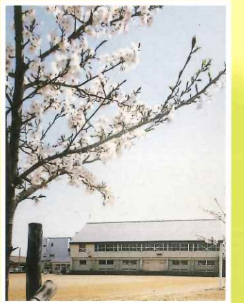
昭和59年 グラウンド東側に 桜植樹