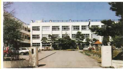
昭和61年 鉄筋3階建て 8教室完成